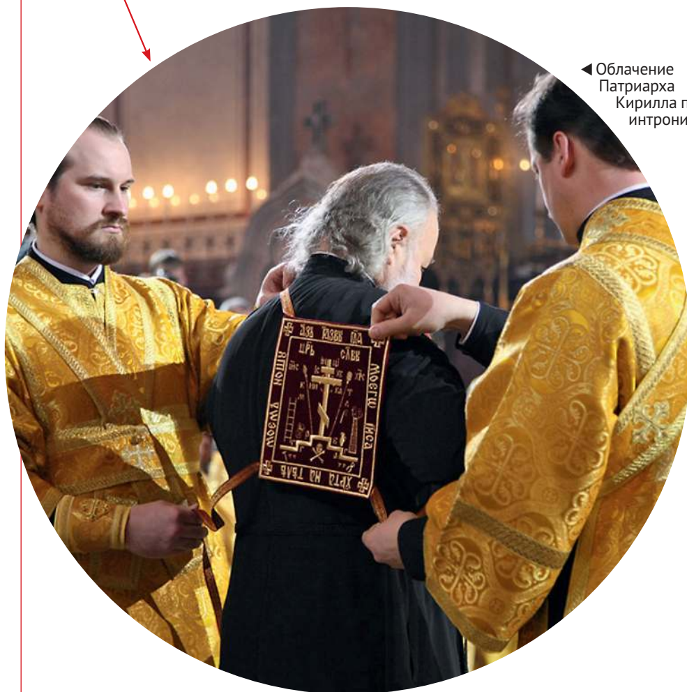
◀ Облачение Патриарха Кирилла перед интронизацией

Великий — носит Патриарх Московский и всея Руси, надевая его поверх подрясника только перед богослужением.